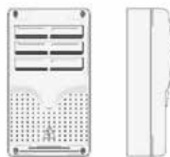
Cuadro de Control